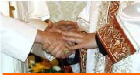
Figura 3: 30 Novembre 2006, incontro tra Benedetto XVI ed il Gran Mufti che lo ha accolto all'ingresso della Moschea Blu di Istanbul.

La tolleranza massonica è una “costruzione progressiva, un vero patto tra uomini di buona volontà, che si elabora innanzitutto per necessità vitale, e in un secondo momento grazie alla ragione. Il primo momento della tolleranza è costituito dal riconoscimento della libertà religiosa.