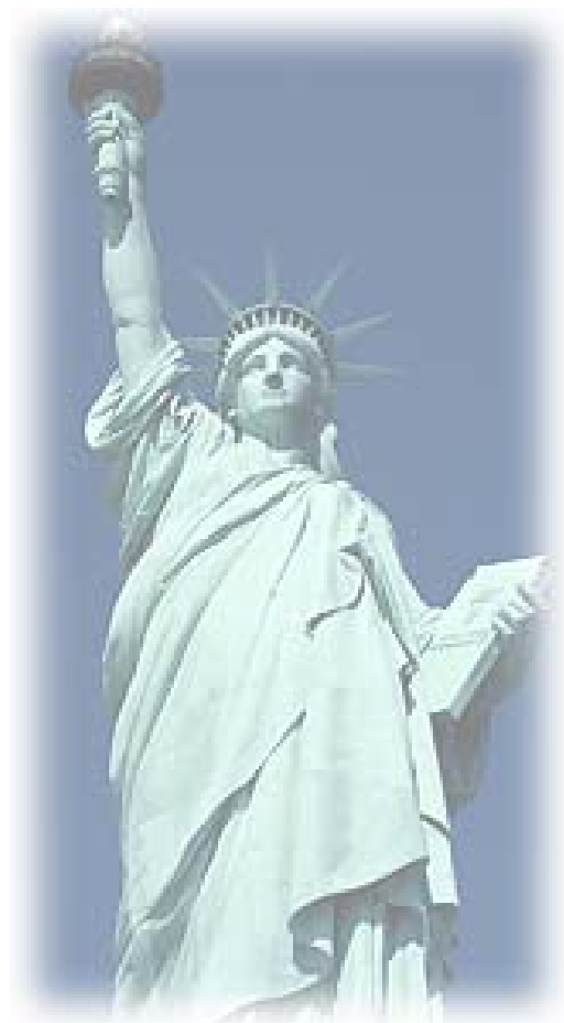
Figura 1: La statua della libertà (realizzata dal Fr. Frederic Auguste Bartholdi)

Aspramente combattuta dai totalitarismi di tutto il mondo (che ne hanno temuto gli ideali fondanti di Libertà, Eguaglianza, Fratellanza) la Massoneria ha sempre trionfato ed ha collaborato, sebbene per vie speculative, alla nascita delle moderne democrazie.