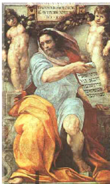
Il Profeta Isaia (Raffaello) Chiesa di S. Agostino (Roma)

L'intellettuale post-moderno, quello del disincanto, abbandona le ambizioni pedagogiche ed universalistiche. Non si riconosce più nel suo ruolo tradizionale, assumendo un atteggiamento pessimistico, anche a causa della domanda sociale che non guarda più ai valori ma alle competenze.