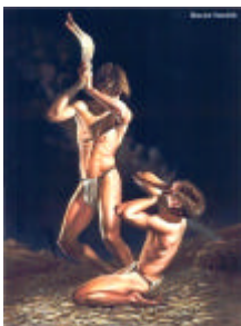
Caino e Abele Maurice Heerdink (2001)

Per perdonare noi stessi dobbiamo conoscere fino in fondo l'eventuale colpa. Nel momento in cui avremo scrutato fino in fondo la nostra capacità di "sbagliare", nel momento in cui ci renderemo conto di non poter giudicare perché anche noi siamo passibili di giudizio, solo allora forse saremo in grado di perdonare davvero, noi stessi prima e gli altri poi.