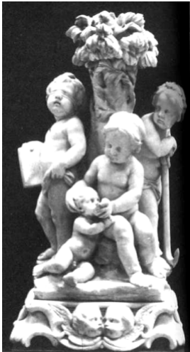
Le Tre Virtù Teologali Laurent Delvaux (XVII sec.)

Il potere non cambia l'uomo, semplicemente lo rivela. Ecco perchè è importante seguire ciò che un "iniziato" di oltre 2000 anni fa ci ha detto: «Cosi anche voi, quando avrete fatto tutto quello che vi è stato ordinato, dite: Siamo servi inutili. Abbiamo fatto quanto dovevamo fare.» (Lc 17,10).